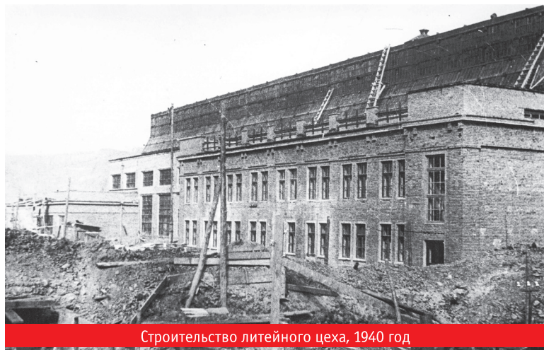
Строительство литейного цеха, 1940 год

низовано в цеховой столовой из фонда спецпитания.